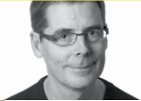
DESIGN: JAKOB BERG

(D) AUSGEBILDET AN DER ARCHITEKTENSCHULE IN KOPENHAGEN 1987. GEWINNER MEHRERER DESIGNPREISE UND EMPFÄNGER DES ARBEITSLEGATES DES STATENS KUNSTFOND.